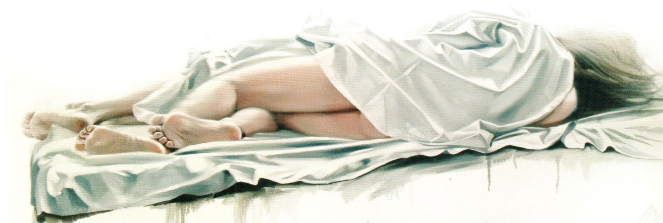
Pair, 2014 Холст, масло 70 x 140 см