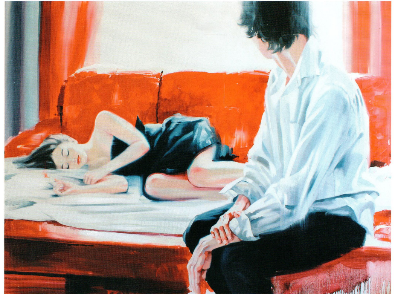
Dream, 2015 Холст, масло 110 x 150 см