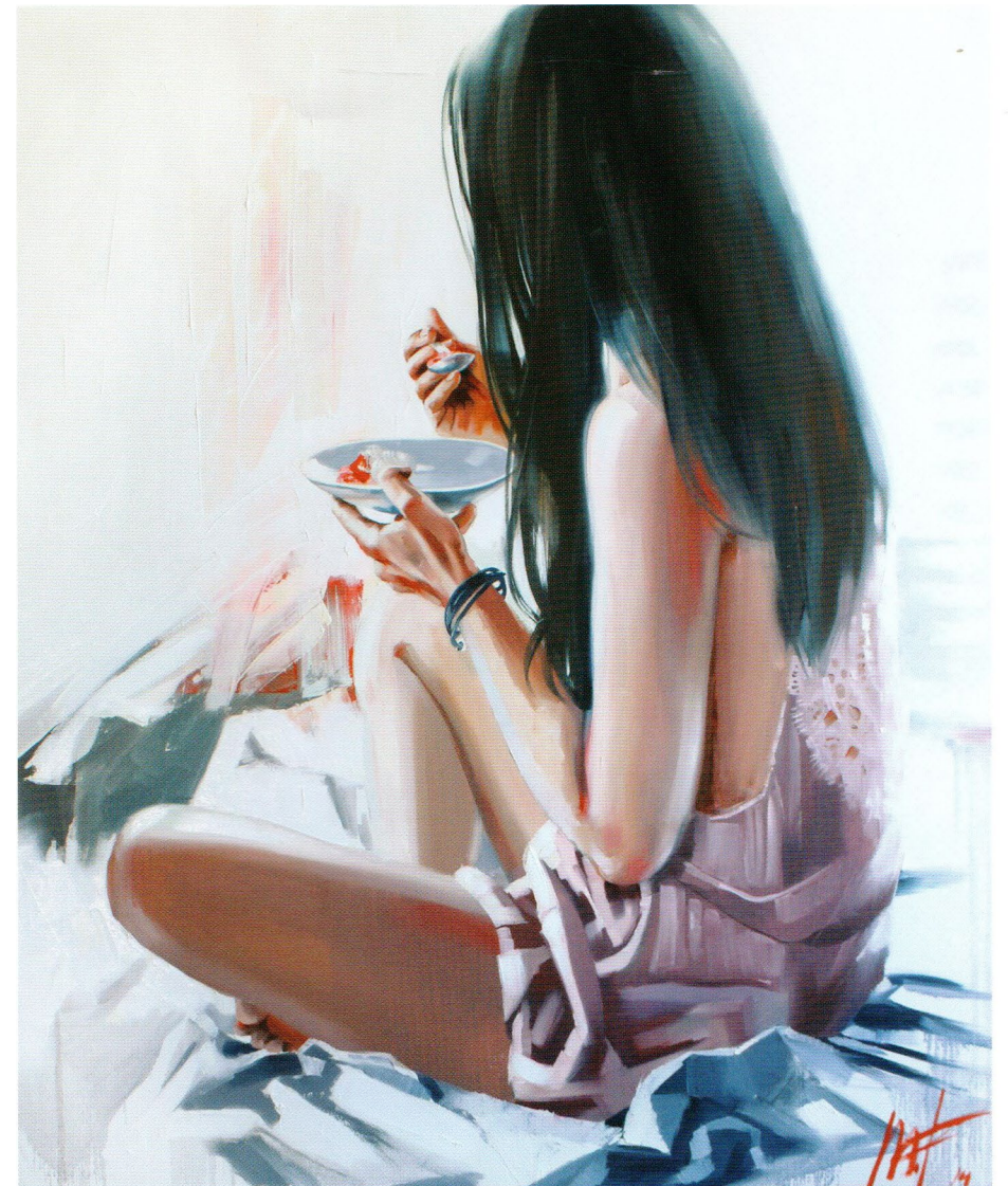
Breakfast, 2014 Холст, масло 120 x 100 см