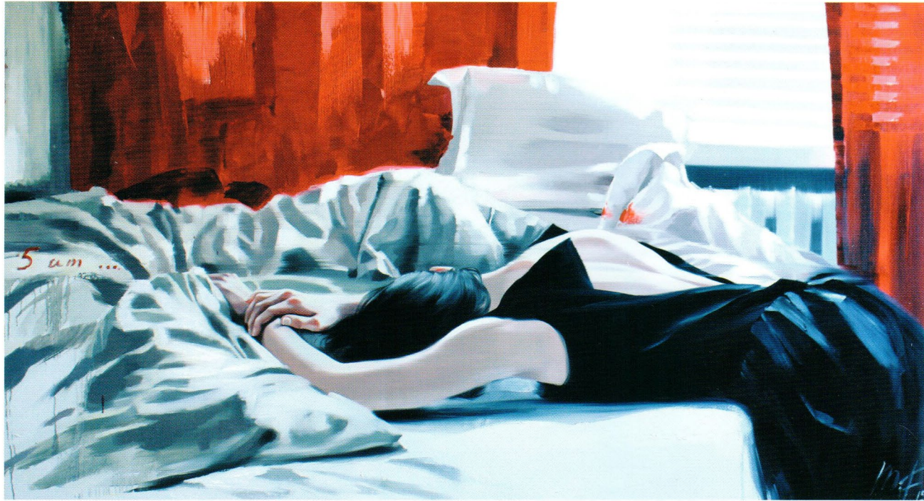
Bed, 2014 Холст, масло 80 x 150 см