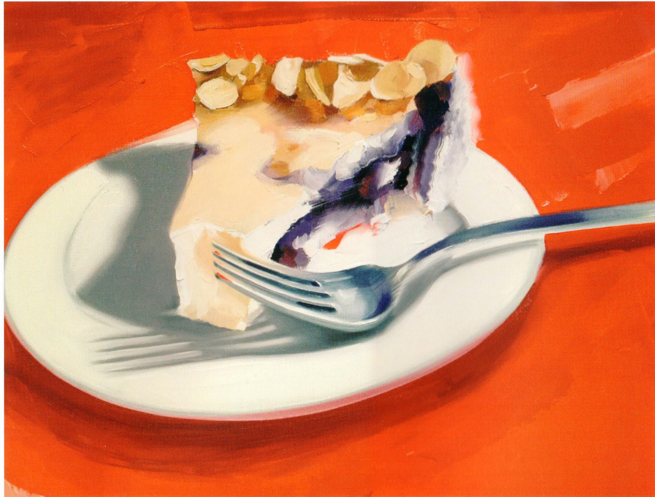
Cake, 2015 Холст, масло 40 x 60 см