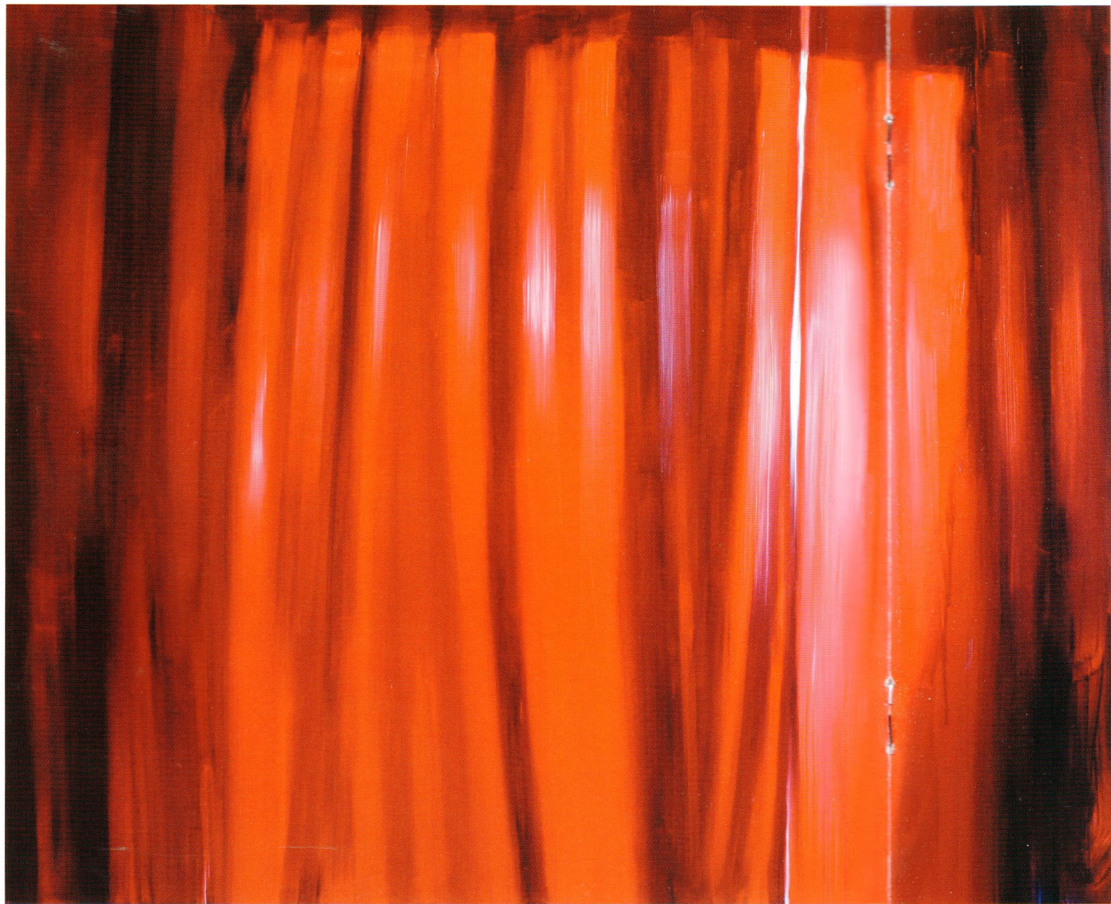
Curtain, 2015 Холст, масло 100 x 120 см