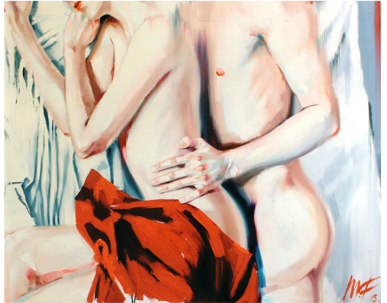
Parallel, 2015 Холст, масло 100 x 120 см