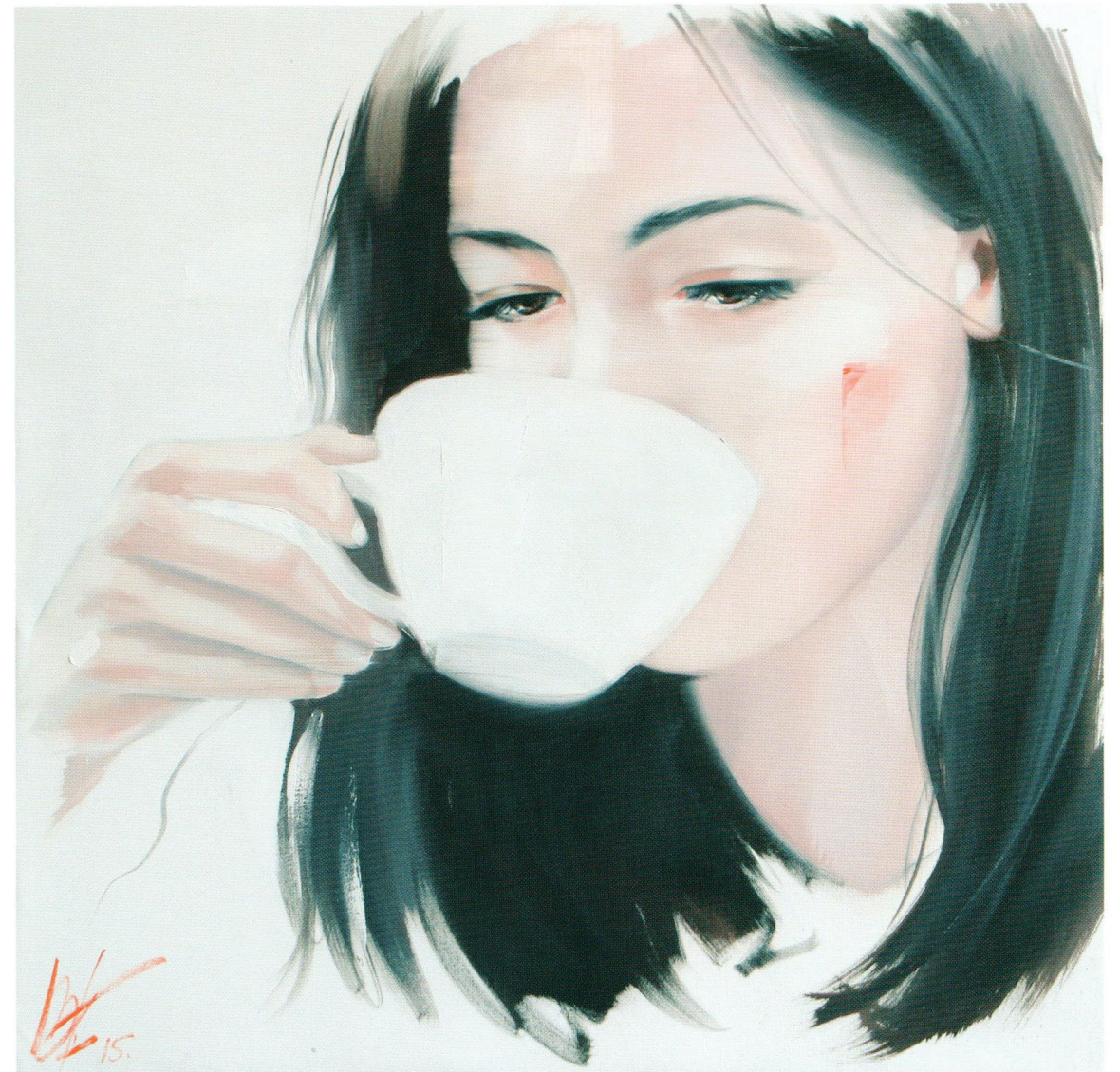
Coffee, 2015 Холст, масло 50 x 50 см