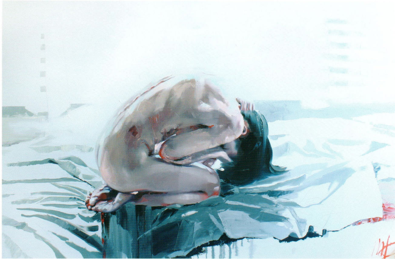
Loneliness, 2014 Холст, масло 95 x 150 см