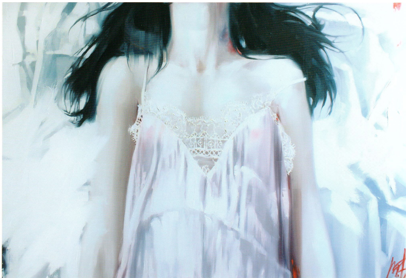
After, 2014 Холст, масло 95 x 150 см