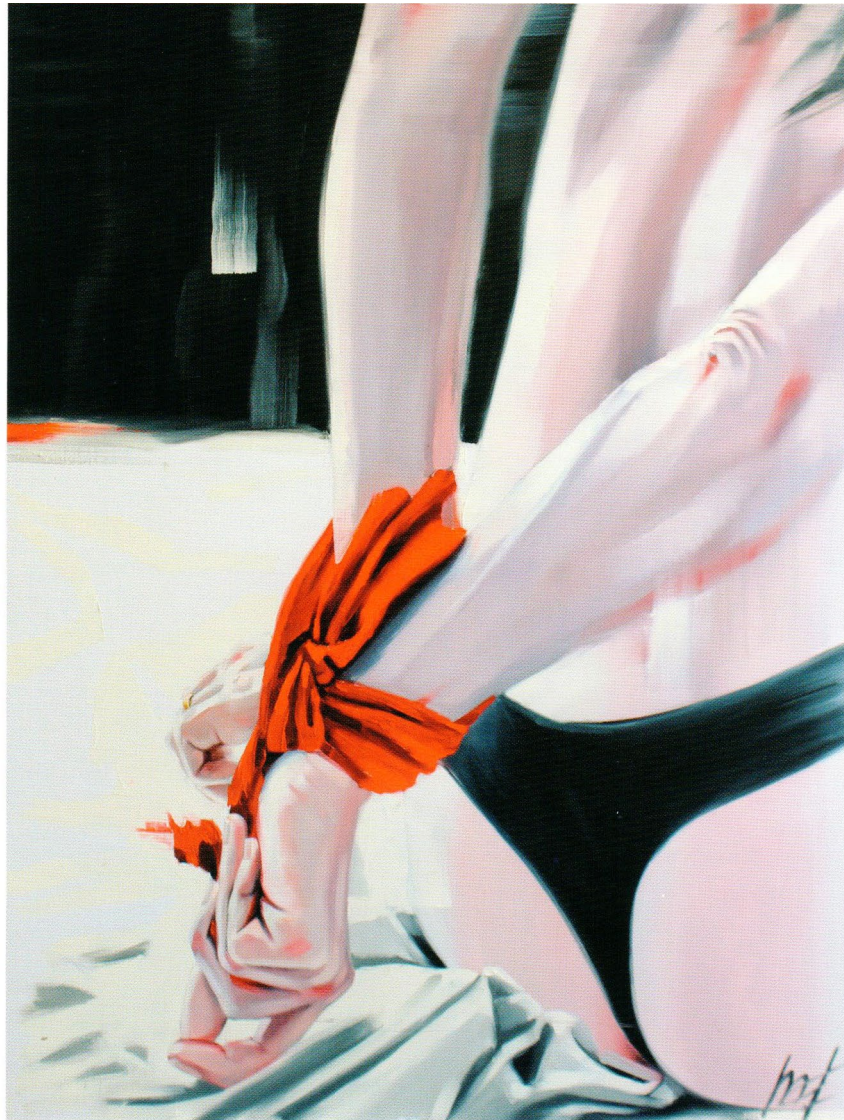
Red Rope, 2014 Холст, масло 85 x 65 см