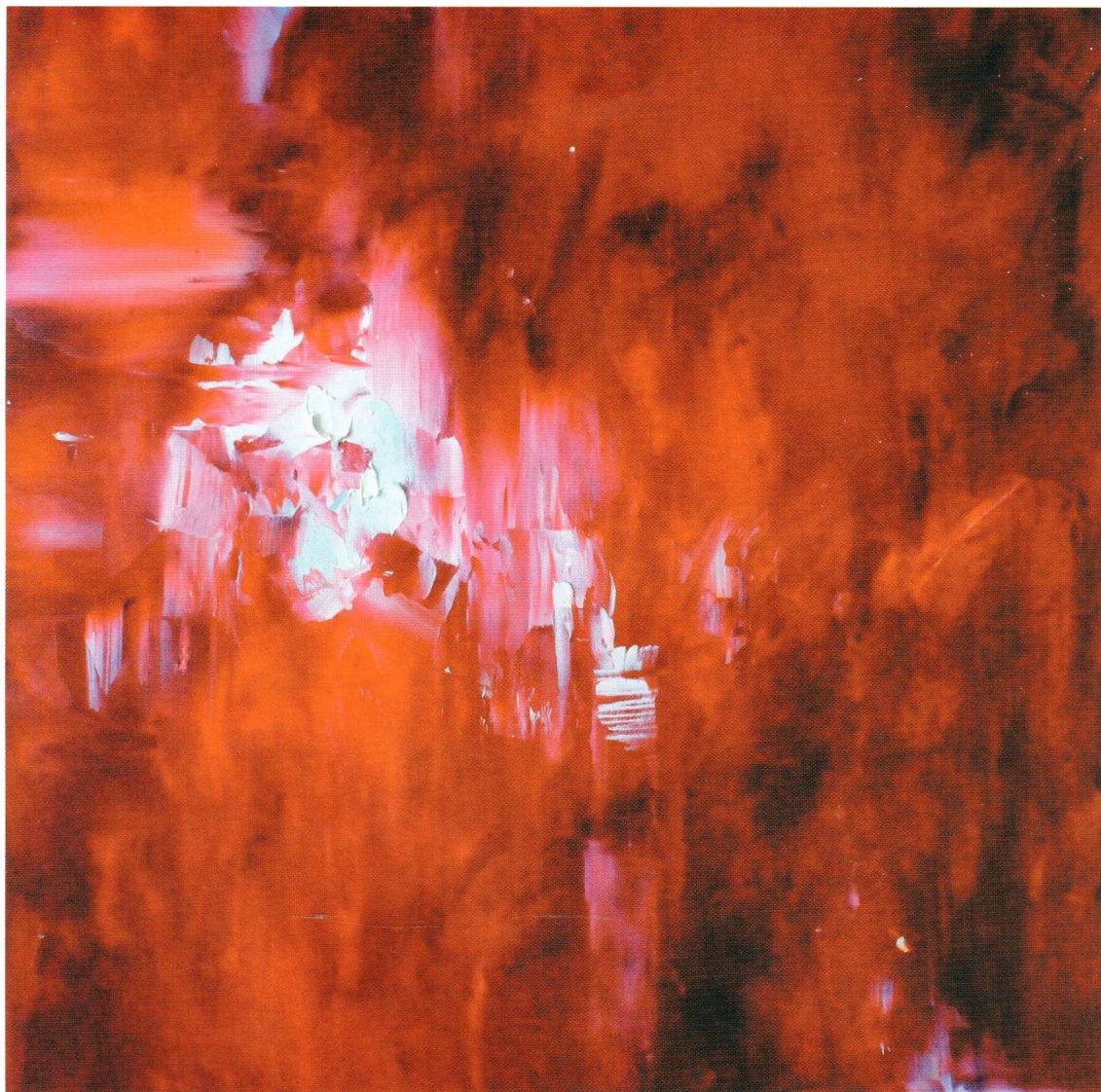
Red, 2015 Холст, масло 50 x 50 см