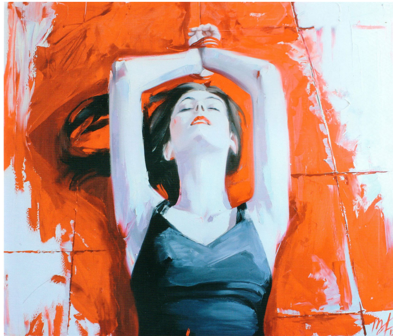
Bounded, 2015 Холст, масло 95 x 105 см