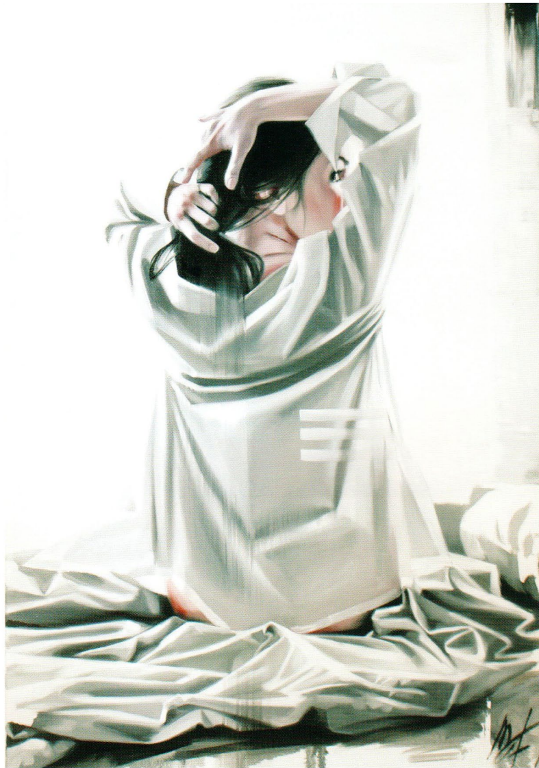
Glance, 2014 Холст, масло 100 x 70 см