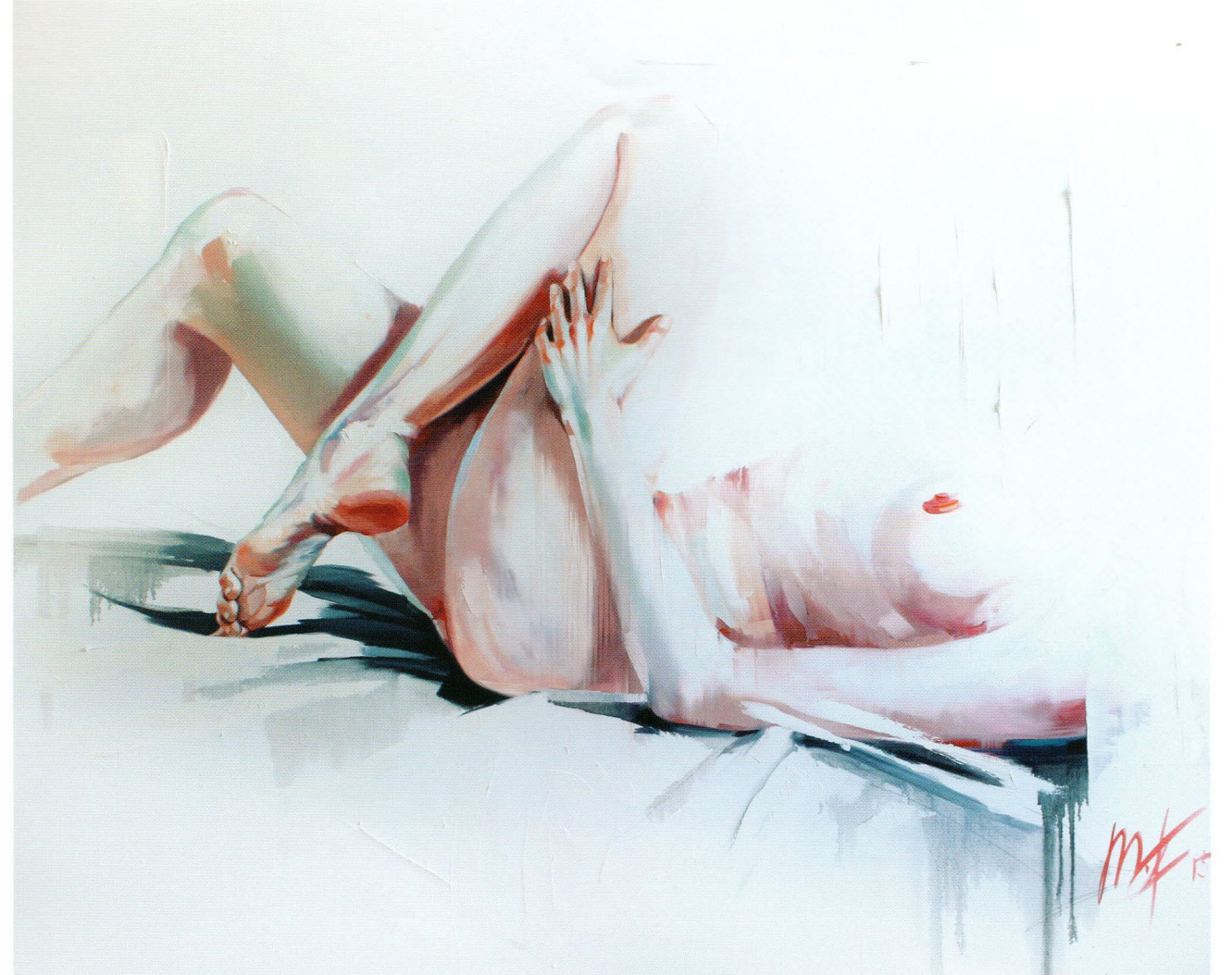
Before, 2015 Холст, масло 100 x 120 см