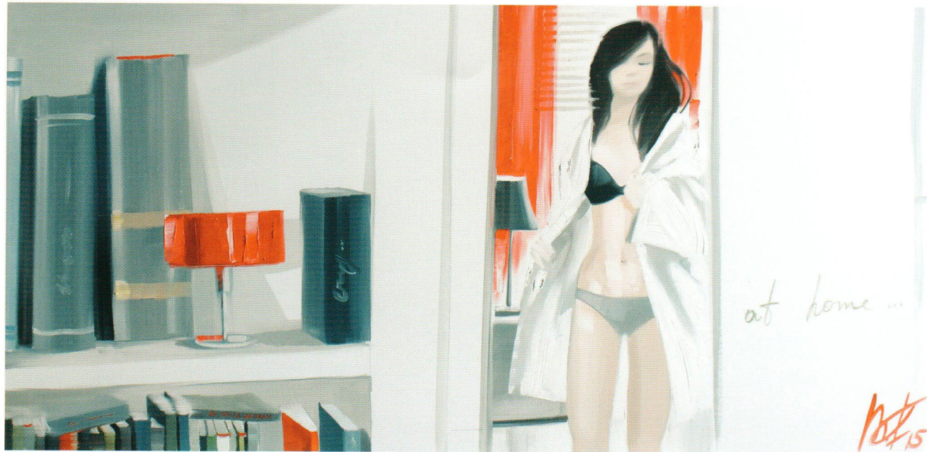
At Home, 2015 Холст, масло 50 x 100 см