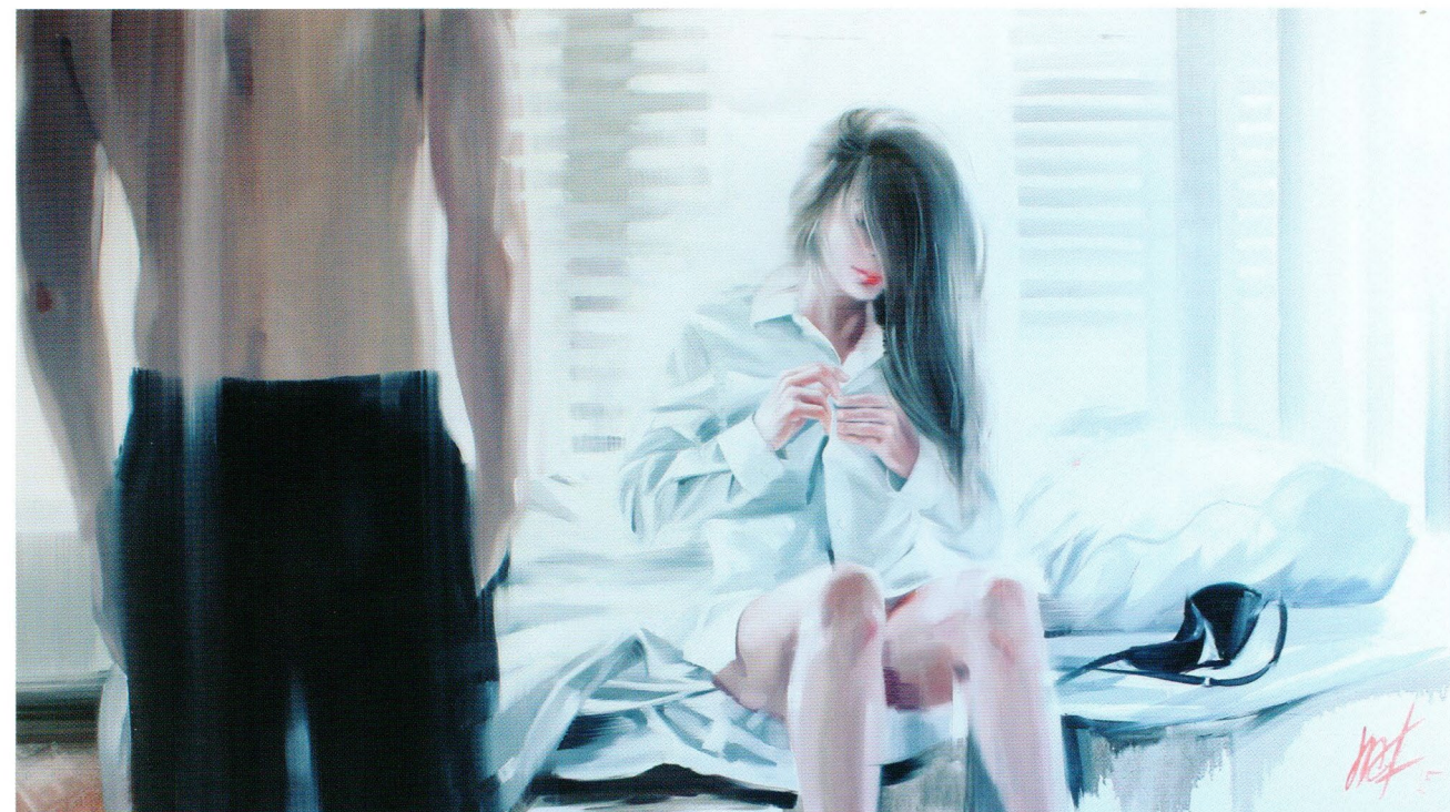
Morning, 2015 Холст, масло 85 x 150 см