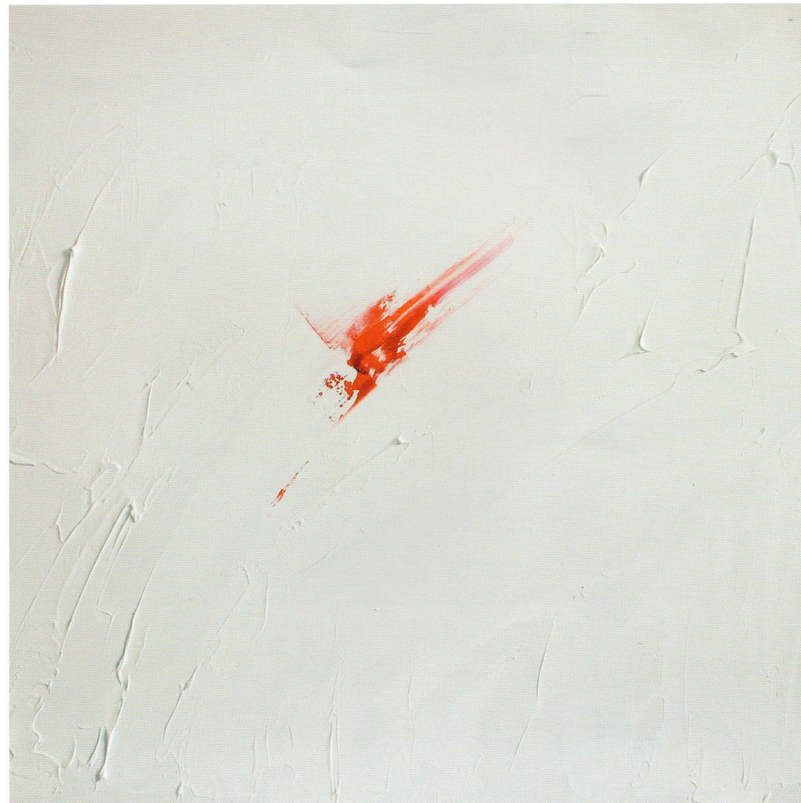
White, 2015 Холст, масло 50 x 50 см