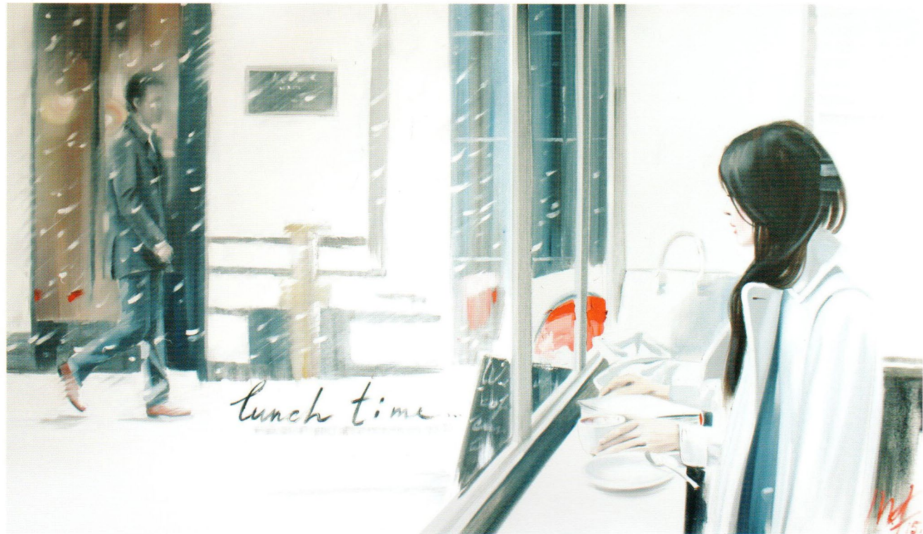
Lunch Time, 2015 Холст, масло 90 x 150 см